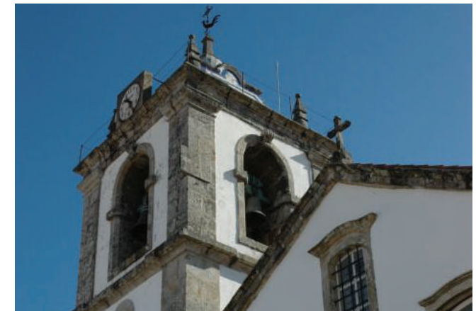
Sinos da Igreja Matriz de Pedrógão Pequeno